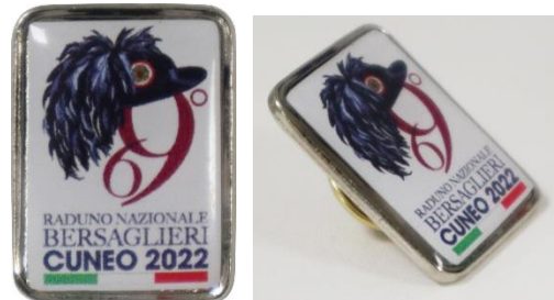
Distintivo da bavero