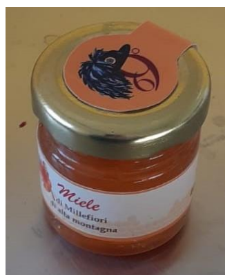
Confezione miele locale