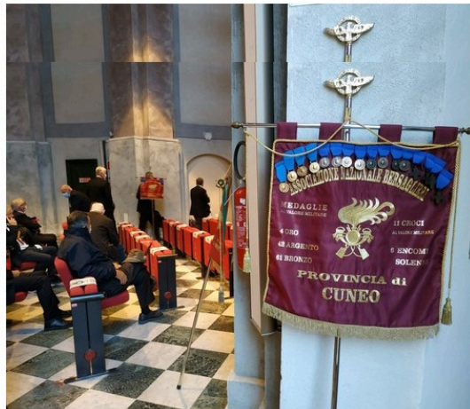
La presentazione dell'evento

I ragazzi saranno ospitati nella caserma Vian dal 30 agosto al 3 settembre